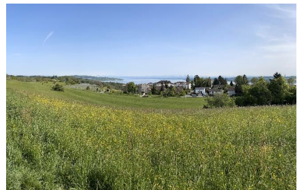
Wiesen kühlen und speichern Wasser